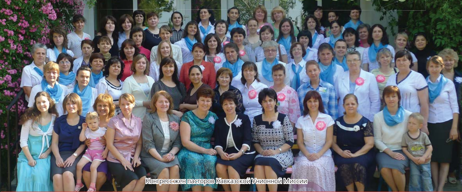
Конгресс жен пасторов Кавказской Унионной Миссии