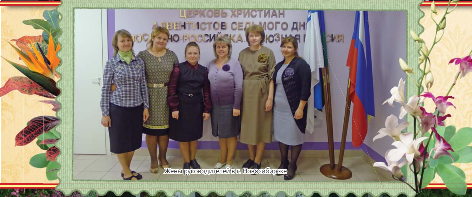
Жены руководителей в г. Новосибирске