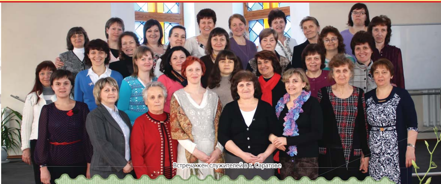
Встреча жен служителей в г. Саратове